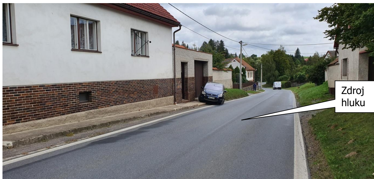
Obr.3: Fotografie měřicího místa, Dolní Bobrová 21, 592 55 Bobrová, okres Žďár nad Sázavou, Kraj Vysočina