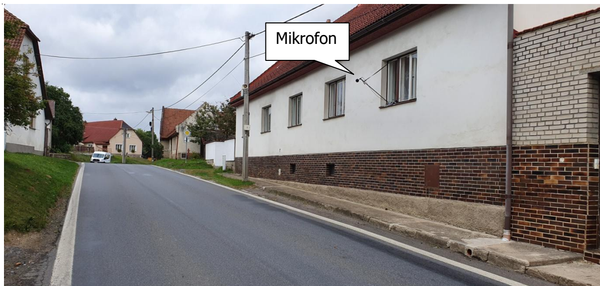
Obr.2: Fotografie měřicího místa, Dolní Bobrová 21, 592 55 Bobrová, okres Žďár nad Sázavou, Kraj Vysočina